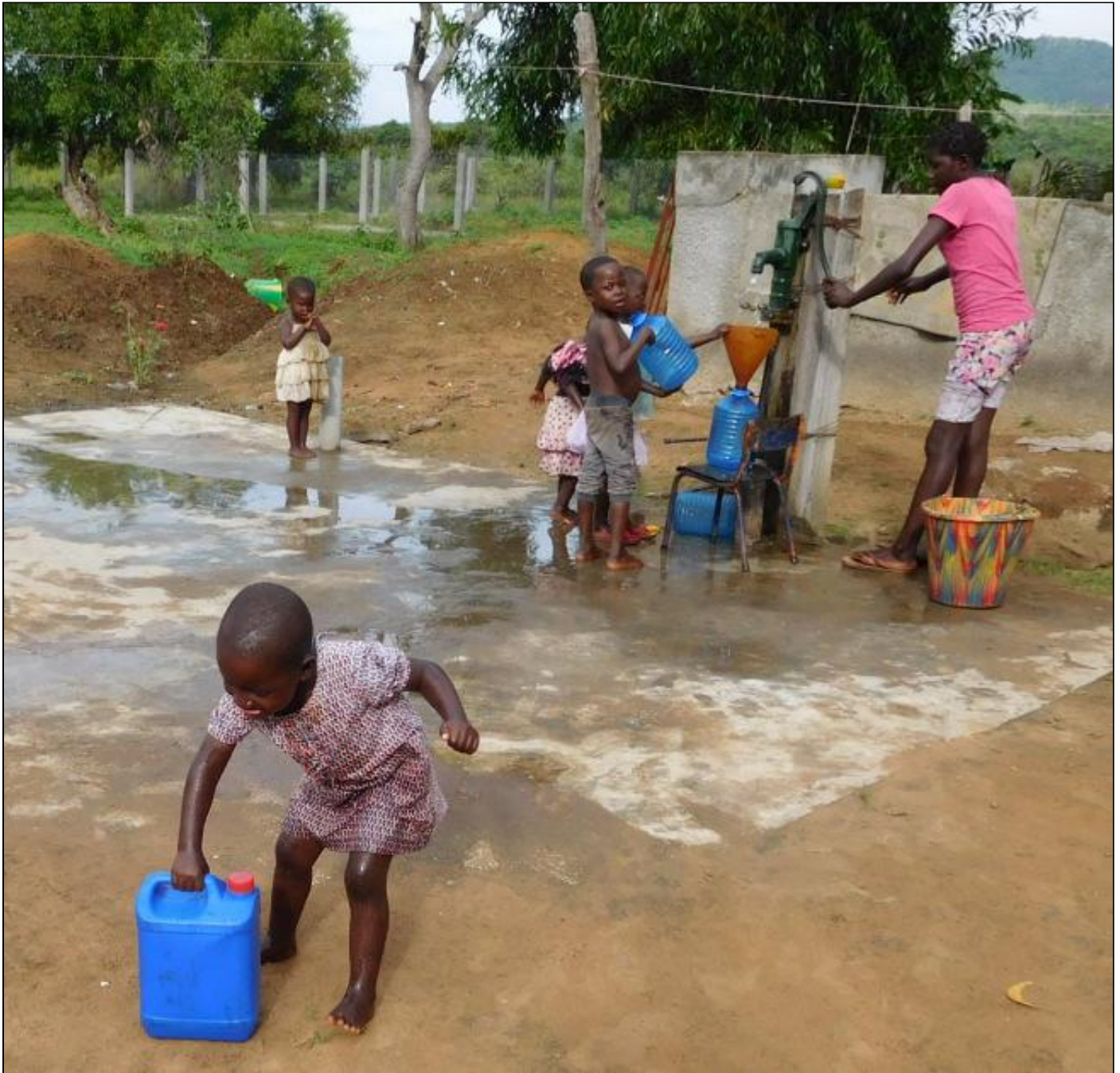
Een van de twee waterkranen in Budjala (3.200 km 2 ) Congo

Gewone bevallingen kosten 1€, en dat is ongeveer haalbaar voor een Congolees. Maar een keizersnede kost veel meer. Met het gespaarde geld van het water wil de gemeenschap de extreem arme vrouwen met een keizersnede helpen de kosten te betalen. Slim toch? Met onze bijdrage zullen dus ongeveer 17.000 mensen van zuiver water kunnen genieten, en zullen pas bevallen mama's hun keizersnede kunnen betalen. En dat allemaal met 1€ per persoon! Dat zal 'loop naar de pomp' iets positiefs betekenen met gestructureerde mededeling 910/4000/00010 (zeker vermelden!); fiscaal attest vanaf 40€/jaar.